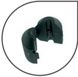
clip ballast 275 g