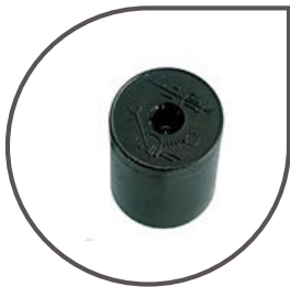
Plastic ballast 200 g