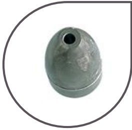
Loades resin ballast 175/250/350 g